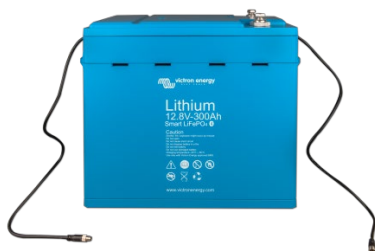
Batterie LiFePO4 12,8 V 300 Ah

Fonction très utile pour localiser un (éventuel) problème, comme un déséquilibre sur les cellules par exemple.